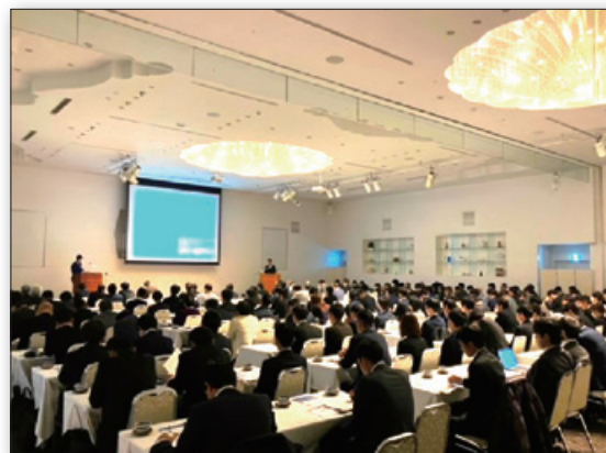
◆県内2会場でインドネシアセミナーを開催。115社、300名超が参加。