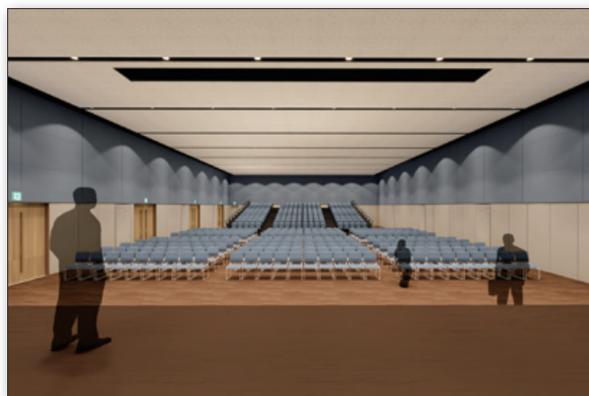
◆ホール面積550㎡、最大収容人数800名。 ◆各種学会や会議・セミナー他、学校関係イベント等にご利用いただける多目的ホールとする計画。