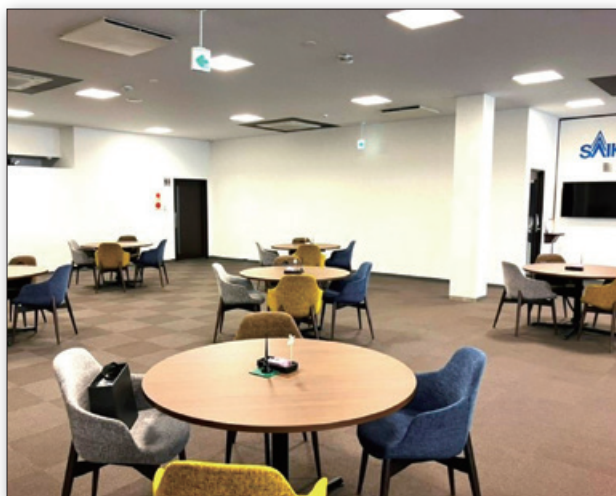
カフェ風インテリアのコンサル店舗